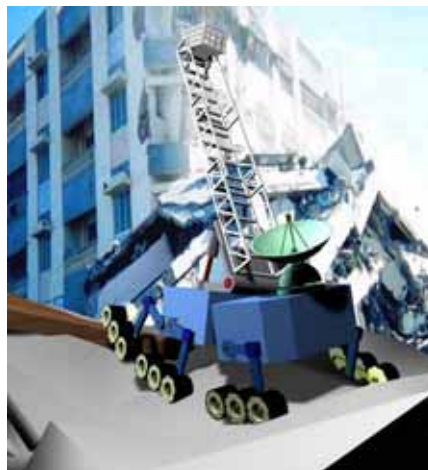
図1 梯子を使った親子型ロボットシステムの基本コンセプト