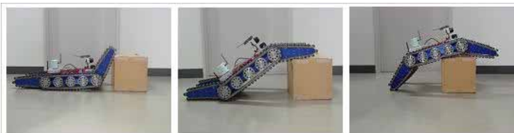
図3 今回開発した子ロボット