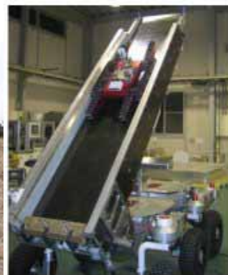
図2 今回開発した親ロボット（伸展式の梯子の上に子ロボットを2台搭載する）